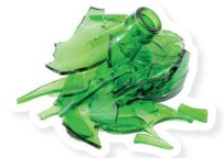
Glasflasker Op til 1.000.000 år